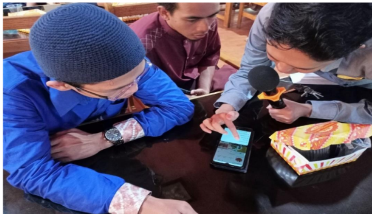
Gambar 3. Suasana Pemberian Pelatihan kepada Wirausaha Muda Banua