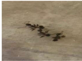
Gambar 1. Semut Kayu Famili yang Paling Banyak Ditemukan.

cocopet, dan semut kayu. Famili Formicidae yaitu salah satu dari famili serangga eusosial yang bersifat kosmopolit dan mempunyai kelimpahan tertinggi (Wilson, 1971).