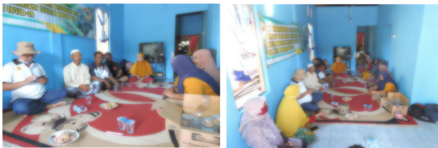
Gambar 3. Kegiatan Penyuluhan PKM

Pada Gambar 3 di bawah ini merupakan kegiatan penyuluhan yang dilakukan Tim bersama mitra