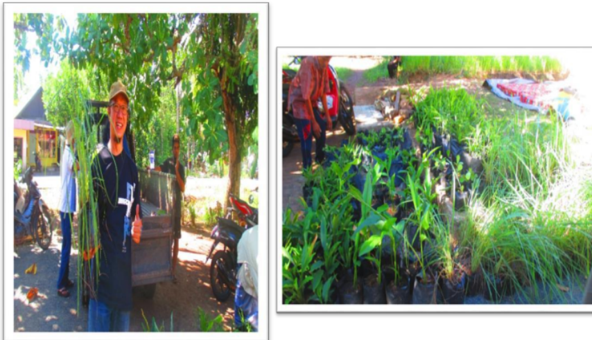
Gambar 2. Penurunan bibit tanaman obat ke Mitra

TOGA adalah tanaman hasil budi daya rumah tangga yang dimanfaatkan sebagai obat, dalam upaya peningkatan kesehatan baik dalam upaya pencegahan, maupun pengobatan. Umumnya TOGA dimanfaatkan sebagai minuman kesehatan yang dapat dikonsumsi baik oleh anak-anak maupun orang dewasa. Jenis TOGA yang dimanfaatkan pada kelompok mitra adalah kunyit, jahe, kencur, bawang Dayak, serai dan lengkuas. Semua bibit didatangkan dari persemaian. Pada Gambar 2 di bawah ini adalah proses penurunan bibit TOGA ke mitra di Desa Mandiangin Timur.