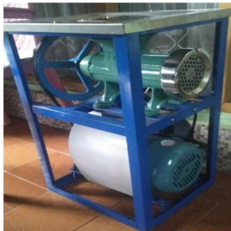
Gambar 9. Mesin penggiling daging

Demonstrasi budidaya maggot dilakukan bersama bapak-bapak pemilik kolam ikan patin. Telur maggot telah disediakan oleh tim PKM, sehingga praktik bisa langsung dilaksanakan. Tabel 1 dan 2 adalah alat dan bahan yang digunakan dalam kegiatan demonstrasi budidaya maggot. Pada Gambar 10 merupakan kegiatan demonstrasi budidaya maggot di Desa Bangkiling Raya.