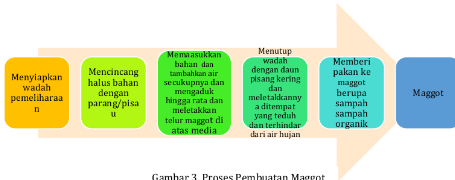
Gambar 3. Proses Pembuatan Maggot

Indikator Keberhasilan. Tingkat keberhasilan kegiatan pengabdian kepada masyarakat ini diukur dengan indikator >80% mitra usaha tahu dan cakap dalam membuat bakso, nugget dari ikan patin dan teknologi budidaya maggot.