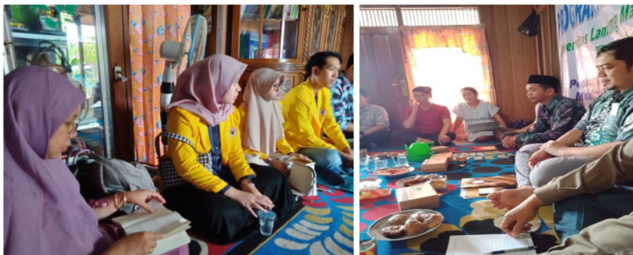
Gambar 4. Kegiatan diskusi bersama masyarakat

Pada kegiatan penyuluhan ini adalah pemaparan materi atau teori mengenai produk ikan patin pasca panen dan diskusi yang dilakukan secara sistematis dan terarah dari suatu grup kelompok tani ikan untuk membahas suatu masalah tertentu yang dalam hal ini adalah masalah produksi dan pemasaran ikan patin. Penyuluhan dan diskusi dilakukan pada tanggal 15 September 2022 yang dihadiri oleh masyarakat yang memiliki kolam ikan, kepala desa dan kepala BPUP Miftahul Ulum. Dari kegiatan diskusi dan penyuluhan ini telah disepakati akan dilakukan pelatihan diversifikasi produk olahan ikan patin menjadi bakso ikan dan nugget, pelatihan pembuatan pakan ikan (maggot) dan penyuluhan pemasaran produk ikan. Pada Gambar 4-6 merupakan kegiatan penyuluhan dan diskusi yang sudah dilakukan kepada mitra.