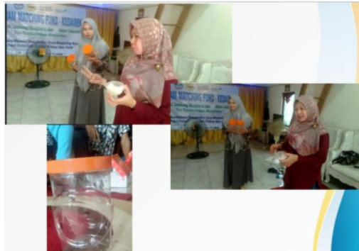
Gambar 6. Kegiatan penyuluhan budidaya maggot