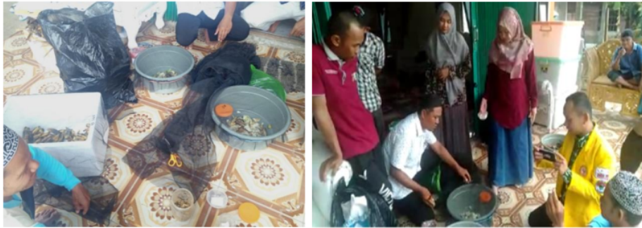
Gambar 10. Demonstrasi produksi maggot di Desa Bangkiling Raya