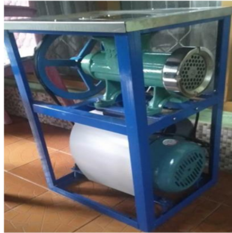
Gambar 9. Mesin penggiling daging

Demonstrasi budidaya maggot dilakukan bersama bapak-bapak pemilik kolam ikan patin. Telur maggot telah disediakan oleh tim PKM, sehingga praktik bisa langsung dilaksanakan. Tabel 1 dan 2 adalah alat dan bahan yang digunakan dalam kegiatan demonstrasi budidaya maggot. Pada Gambar 10 merupakan kegiatan demonstrasi budidaya maggot di Desa Bangkiling Raya.