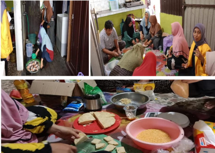
Gambar 7. Demonstrasi pembuatan bakso dan nugget