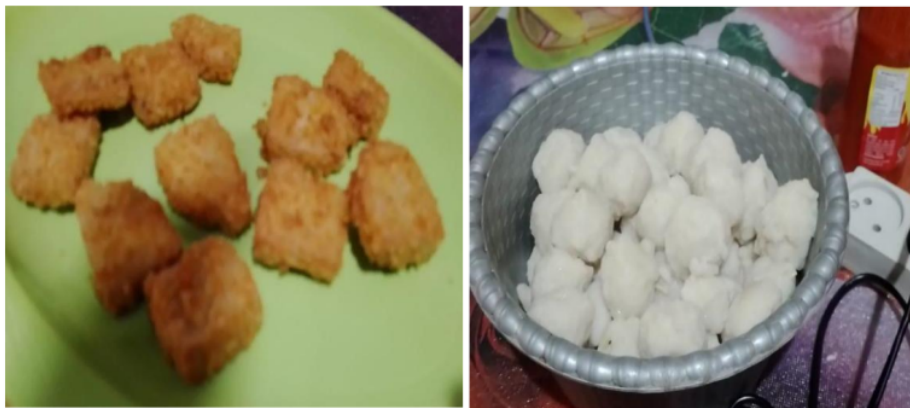
Gambar 8. Bakso dan Nugget ikan patin olahan ibu-ibu Desa Bangkiling Raya