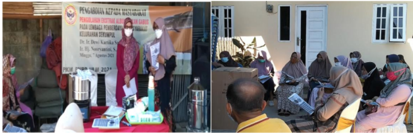
Gambar 2. Kegiatan PKM Pembuatan Albumin

Partisipasi khalayak sasaran dalam kegiatan PKM merupakan bentuk pemberdayaan masyarakat. Interaksi antara tim pengabdian dengan mitra sangat mendukung tercapainya tujuan kegiatan PKM. Partisipasi mitra dalam pelaksanaan kegiatan pengabdian Program Kemitraan Masyarakat (PKM), yaitu: (1) ikut terlibat dalam identifikasi masalah; (2) ikut terlibat dalam menentukan skala prioritas permasalahan yang akan dipecahkan dalam kegiatan PKM; (3) bersedia mengikuti kegiatan penyuluhan, pelatihan dan demonstrasi penerapan teknologi pengolahan ekstrak albumin yang dilaksanakan tim pengabdian; dan (4) dan bersama-sama dengan tim pengabdian melakukan evaluasi dan keberlanjutan program PKM pengolahan ekstrak albumin berbasis ikan gabus. Kegiatan PKM pembuatan albumin ikan gabus pada Gambar 2.