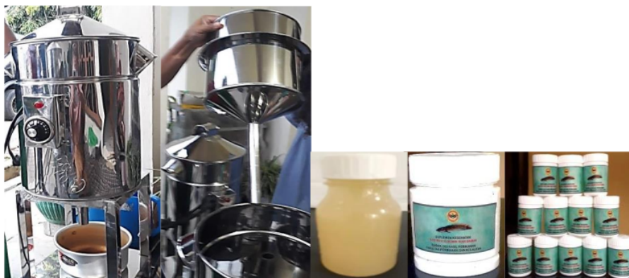
Gambar 4. Peralatan Ekstraksi dan Ekstrak Albumin Ikan

Selesai proses ekstraksi, ekstrak albumin siap untuk dikonsumsi. Ekstrak albumin jika disimpan pada suhu ruang hanya bertahan selama 1 hari, disimpan pada ruang dingin dalam kulkas (suhu dingin) dapat bertahan selama 3 hari dan jika disimpan dalam ruang freezer (suhu beku) dapat bertahan selama 1 bulan. Ekstrak albumin beku sebelum dikonsumsi harus dilakukan proses thawing/pencairan.