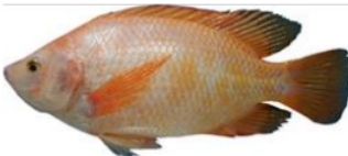
Nila ( Oreochromis niloticus )