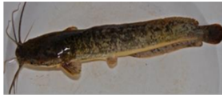
Lele ( Clarias sp.)