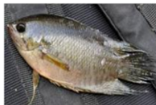
Kapar ( Belontia Hasselti )