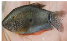
Sepat rawa ( Trichogaster trichopterus )