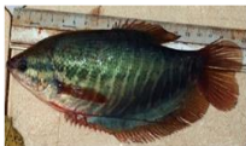
Sepat siam ( Trichogaster pectoralis )