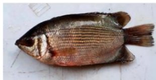
Biawan ( Helostoma temminkii )