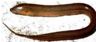
Belut ( Monopterus albus )