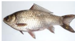
Puyau ( Osteichilus hasselti )