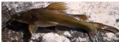
Baung ( Mystus Nemurus )