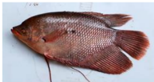
Gurame ( Oreochromis Mossambicus )