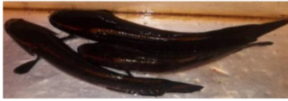
Gabus ( Ophiocephalus striatus )