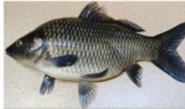
Mas ( Cyprinus carpio L.)