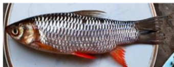
Tawes ( Barbonymus gonionotus )