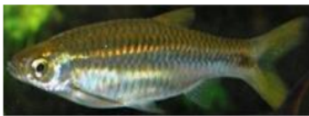
Seluang ( Rasbora argyrotaenia )