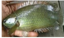
Betok ( Anabas testudineus )