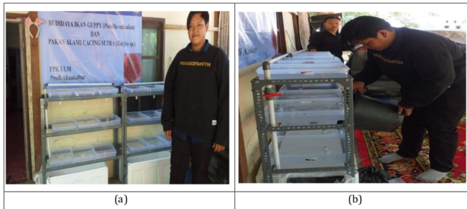
Gambar 2. Persiapan (a) wadah Budidaya Cacing sutra dan (b) Pengisian air

Penyerahan alat dan bahan yang digunakan dalam proses demonstrasi budidaya cacing sutra, sekaligus pemasangan atau instalasi alat dan bahan dilakukan waktunya bersamaan dengan kegiatan penyuluhan. Wadah budidaya cacing sutra dapat dilihat pada Gambar 2.