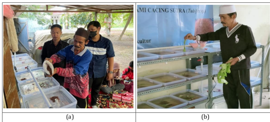
Gambar 3. Kegiatan (a) Praktek Penebaran dan (b) Pemberian Pakan ikan

Kegiatan yang bersifat teoritis dilaksanakan di tempat salah satu rumah warga, kegiatan dapat berjalan dengan baik sesuai harapan serta dihadiri khalayak sasaran sebanyak 10 orang. Kegiatan demonstrasi dilakukan dengan praktek langsung instalasi peralatan budidaya dan media hidup cacing sutra. Setelah selesai instalasi peralatan dan media dilakukan penebaran dan percontohan praktek cara pemberian pakan (Gambar 3). Pemeliharaan dilakukan secara mandiri oleh kelompok khalayak sasaran sampai masa panen dan dilakukan monitoring dan pendampingan.