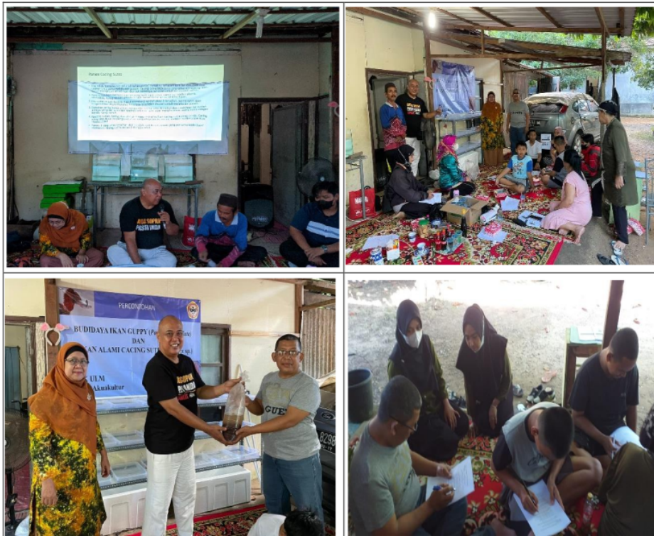
Gambar 1. Kegiatan Penyuluhan Budidaya cacing sutra di pekarangan

Kegiatan Pengabdian kepada Masyarakat (PkM) telah dilaksanakan pada Kelompok masyarakat KIMDAM VI Tanjung Pura (transad), Kelurahan Guntung Manggis RT 21 RW 03 Kecamatan Landasan Ulin pada hari Sabtu tanggal 23 Juli 2022, dalam usaha budidaya cacing sutra di lahan pekarangan. Kegiatan yang dilaksanakan dalam PkM ini terdiri dari kegiatan penyuluhan, demonstrasi dan kegiatan evaluasi terhadap khalayak sasaran (Gambar 1), juga dilakukan evaluasi terhadap kegiatan yang dilakukan.