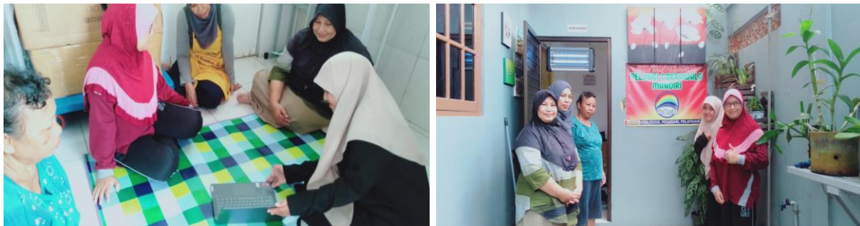
Gambar 1. Pelaksanaan Kegiatan Pengabdian

Laporan keuangan merupakan alat untuk dapat menganalisis posisi keuangan, kegiatan, serta arus kas, sehingga berfungsi untuk pengambilan keputusan oleh manajemen dalam hal ini yaitu pemilik dari UMKM POKLAHSAR Pelangi Cakrawala Mandiri. Dari laporan keuangan ini juga lembaga keuangan dapat mengambil keputusan untuk dapat memberikan pinjaman atau tidak terhadap sebuah UMKM yang telah mengajukan pinjaman. Menjadi suatu tantangan untuk kalangan akademisi agar para pelaku UKM ini dapat meningkatkan kesadaran mengenai arti pentingnya laporan keuangan melalui pembukuan ini dalam pengembangan usaha mereka selanjutnya.