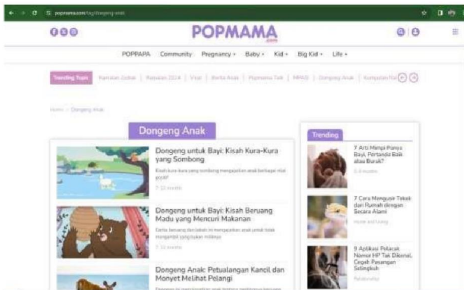
Gambar 1. papan instrumen situs web dongeng anak Popmama.com

Kajian ini, melalui penerapan algoritma Neural Network , mengeksplorasi kedalaman dan keragaman genre dalam kumpulan dongeng yang tersedia di popmama.com . Pendekatan ini memungkinkan analisis yang lebih detail dan sistematis terhadap elemen-elemen naratif, termasuk gaya bahasa, motif, dan struktur cerita (Alifuddin et al., 2022). Dengan demikian, penelitian ini tidak hanya mengidentifikasi kategori genre yang ada, tetapi juga memaparkan bagaimana elemen-elemen ini saling berinteraksi dan berkontribusi dalam pembentukan genre (Kartika et al., 2023) (Tressyalina et al., 2023). Hasil ini akan memberikan wawasan penting bagi penulis, pendidik, dan orang tua dalam memahami dinamika konten dongeng dan bagaimana cerita-cerita tersebut dapat beradaptasi dengan kecenderungan serta kebutuhan anak di zaman yang terus berubah ( 1-Studie-Manakova-5-28.Pdf , n.d.).