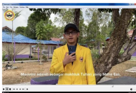
Gambar 2. Penyampaian Materi Pembelajaran oleh Mahasiswa Berkebutuhan Khusus (MBK)

Selain menciptakan pembelajaran yang aktif dan komunikatif, penggunaan video pembelajaran juga dapat membantu dosen dalam kegiatan pembelajaran dan mengelola kelas. Kelas mata kuliah Pendidikan Pancasila merupakan kelas yang inklusif, dimana tidak hanya mahasiswa reguler, tetapi juga terdiri dari mahasiswa tunarungu, tunadaksa, tunanetra, mahasiswa dengan hambatan belajar, dan autis. Pelibatan mahasiswa dalam video pembelajaran sebagai media pembelajaran memberikan dampak positif terhadap mahasiswa. Mahasiswa lebih mudah dikelola dan mahasiswa lebih mudah menyerap terhadap materi ajar yang disajikan. Sudiarta dan Sandra didalam Parlindungan et al (2020) menyatakan bahwa media video pembelajaran merupakan sebuah solusi untuk mengatasi kemampuan mahasiswa yang rendah dalam memahami pembelajaran. Penggunaan video pembelajaran dalam proses perkuliahan memudahkan mahasiswa dalam memahami materi pembelajaran.