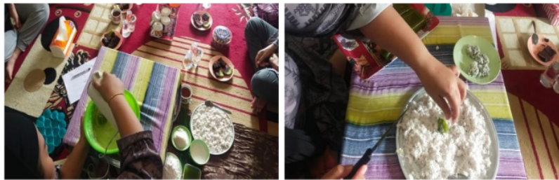
Gambar 6. Demonstrasi langkah-langkah pembuatan kuliner