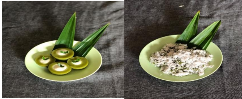
Gambar 7. Kue berbahan dasar daun pandan