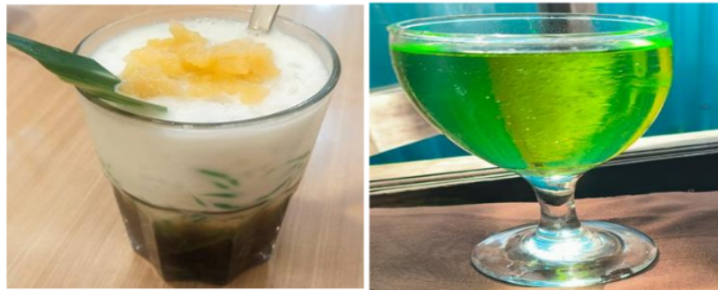
Gambar 8. Minuman berbahan dasar daun pandan