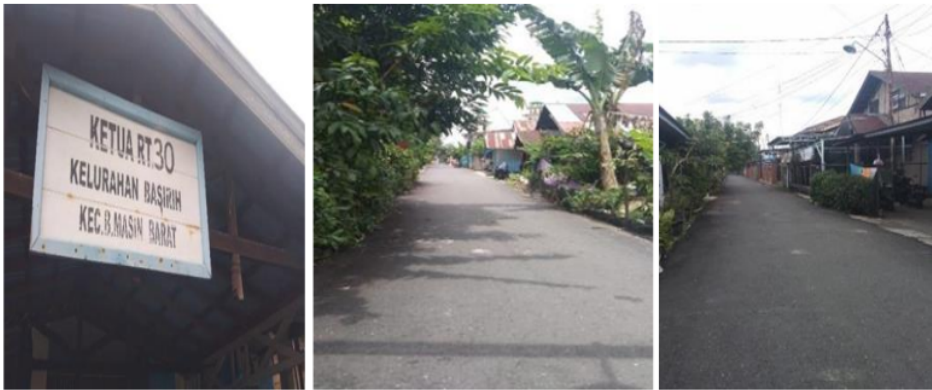
Gambar 2. Kondisi lingkungan RT 30 kelurahan Basirih, Kecamatan Banjarmasin Barat