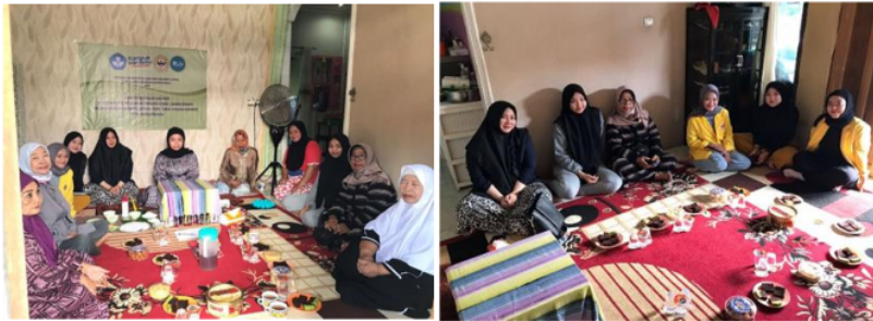
Gambar 5. Narasumber dan peserta pelatihan kuliner