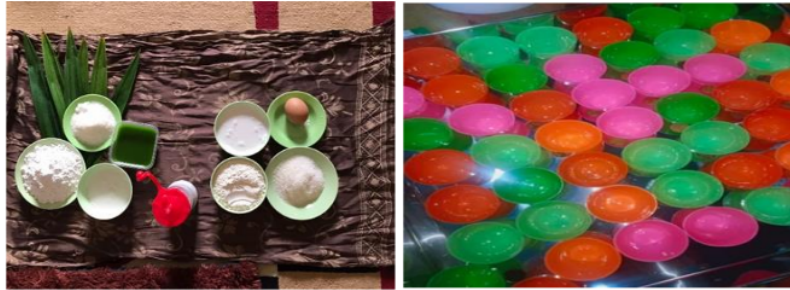
Gambar 4. Alat dan bahan pembuatan kue dan minuman berbahan dasar daun pandan

mendemonstrasikan pembuatan kuliner sampai menghasilkan produk olahan kuliner; (6) Peserta menata dan menyajikan produk olahan hasil pelatihan; dan (7) Sesi diskusi bersama narasumber dengan peserta tentang kesulitan maupun rasa dari produk kuliner berbahan dasar lahan basah. Berikut kami sajikan foto-foto pelaksanaan kegiatan pelatihan kuliner.