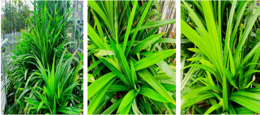
Gambar 3. Tanaman Pandan di halaman rumah masyarakat