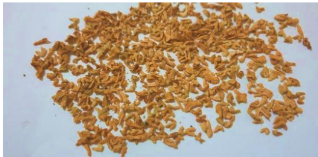
Gambar 1. Pemilihan biji rambai

Upaya perbanyak/pembibitan tumbuhan rambai mangrove melalui biji, kelompok mitra lebih mudah untuk melakukan perbanyak/persemaian melalui biji dimana anggota kelompok mitra kebanyakan dari nelayan atau pencari ikan, saat nelayan mencari ikan bisa melakukan pengumpulan biji yang jatuh kepermukaan air dan nelayan mengambil dan mengumpulkan sebagai stok bahan biji untuk disemai. Pemisahan daging buah rambai dan bijinya dilakukan agar biji terpisah dari dari daging buahnya, biji di cuci bersih, dikering anginkan hingga kadar airnya berkurang. Pemilihan biji rambai siap untuk perbanyak/persemaian dapat dilihat pada Gambar 1.