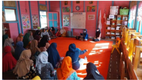
Gambar 4. Penyuluhan tentang bahaya stunting kepada para orang tua murid

Selain praktik bercerita dengan boneka tangan dan senam otak juga diberikan penyuluhan tentang bahaya stunting kepada orang tua (ibu) murid TK Tunas Bangsa Margasari Ilir. Materi yang diberikan meliputi tumbuh kembang anak, penyebab stunting, dampak negatif stunting dan cara pencegahannya.