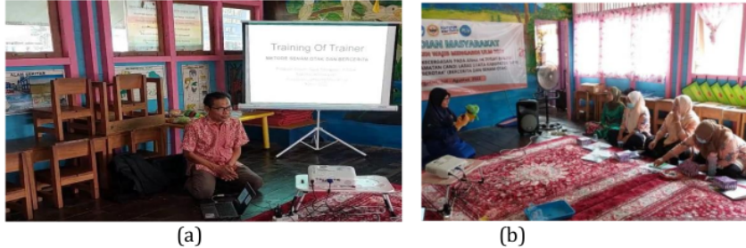
Gambar 2. Training of Trainer (a) Penjelasan (b) Demonstrasi

Setelah pretes dilakukan penjelasan tentang stimulasi kecerdasan dan demonstrasi cara senam otak dengan melihat tayangan video dari media LCD serta cara melakukan kegiatan bercerita dari masing-masing boneka tangan dengan berbagai karakter.