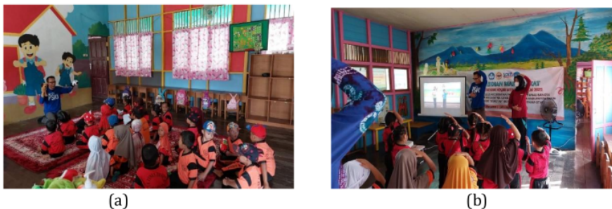
Gambar 3. Praktik BEROTAK (a) Bercerita (b) Senam Otak

BEROTAK adalah stimulasi kecerdasan dengan bercerita dan senam otak yang diperkenalkan oleh tim PKM kepada guru dan murid TK Tunas Bangsa Margasari Ilir. Metode bercerita menggunakan boneka tangan adalah kegiatan bercerita yang alat bantu berceritanya berupa boneka tangan yang sudah disesuaikan dengan cerita yang akan disampaikan (Nuraida, 2018). Senam otak adalah beberapa gerakan yang sederhana yang dimaksudkan untuk menyatukan tubuh dan pikiran (Pratiwi & Pratama, 2020). Guru – guru di TK Tunas Bangsa belum pernah menggunakan boneka tangan saat bercerita kepada murid – muridnya dan juga belum pernah melakukan senam otak pada murid – muridnya. Padahal kegiatan bercerita dan senam otak ini bisa meningkatkan kecerdasan pada anak. Tim PKM mendemonstrasikan bercerita model boneka tangan dan senam otak dengan disajikan pada Gambar 3.