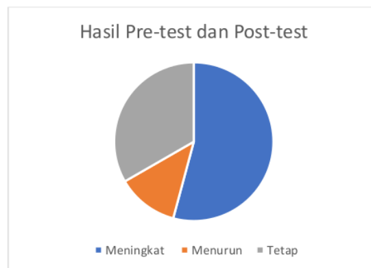
Gambar 5. Grafik hasil pretes dan posttest orang tua siswa

Sebelum dan sesudah dilakukan penyuluhan terkait stunting dan pencegahannya, dilakukan pretes dan postes untuk mengetahui tingkat pengetahuan orang tua murid tentang stunting dan cara mencegahnya. Rerata nilai pretes yaitu 6,04 dan postes 6,79.