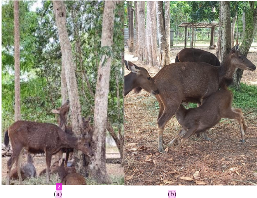
Gambar 7. Aktivitas sosial rusa sambar lainnya (a) memanjat pohon dan (b) rusa anakan sedang menyusu pada induknya