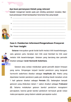
Gambar 2. Fase kedua pembelajaran pemodelan fisika pada e-modul

Fase pertama pembelajaran pemodelan fisika berhubungan dengan indikator pertama keterampilan pemecahan masalah yaitu memahami masalah. Hal ini dilakukan dengan mengidentifikasi masalah oleh peserta didik dengan menuliskan fenomena fisis apa saja yang terjadi berdasarkan fenomena fisis yang diajukan. Fase kedua pembelajaran pemodelan fisika yaitu pemberian informasi/ pengetahuan prasyarat dioperasionalkan dalam e-modul seperti pada Gambar 2.