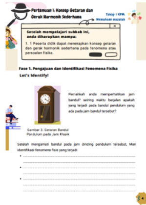
Gambar 1. Fase satu pembelajaran pemodelan fisika pada e-modul

Pembelajaran pemodelan fisika cocok untuk meningkatkan keterampilan pemecahan masalah pada tiap fase nya. Fase pertama pembelajaran pemodelan fisika yaitu pengajuan dan identifikasi masalah/ fenomena fisis. Fase pertama P2F dapat dioperasionalkan dalam e-modul seperti pada Gambar 1.