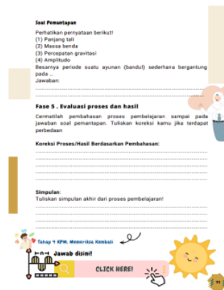
Gambar 5. Fase kelima P2F evaluasi proses dan hasil

Fase kelima pada pembelajaran pemodelan fisika yaitu evaluasi proses dan hasil yang dioperasionalkan pada e-modul seperti Gambar 5.