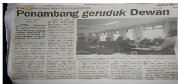
Gambar 3.2 Aksi penambang menyambang gedung DPRD pada tahun 2008

Wacana untuk dilegalkannya pertambangan berumur kurang lebih 2 dekade itu. Pada kesempatan tersebut Agus meminta bapak bupati untuk membuat perjanjian agar membuka kembali pertambangan emas rakyat yang sempat ditutup secara sepihak. Walaupun pada dasarnya penuntutan untuk diberikan izin sudah berlangsung pada tahun 2008 lalu. Tetapi sampai 2015 belum ada kepastian kapan perizinan terhadap pertambangan di Desa Kalirejo bisa diselesaikan. Pada gambar 2 yang memperlihatkan aksi penambang pada tahun 2008 lalu untuk meminta kepastian tentang status penambangan yang mereka jalankan.