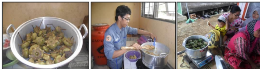
Gambar 2. Kegiatan Perlakuan Pengolahan Pada Buah Mangrove

Teknik penghilangan tanin dan HCN merupakan prosedur utama yang wajib dilakukan dengan inikator daging buah dan daun yang awalnya berwarna coklat tua berubah menjadi coklat muda. Kadar HCN setelah perebusan sebesar 0,72 mg setelah perendaman dalam abu sekam padi sebesar 0,206 mg, sedangkan kadar tanin setelah perebusan 28,2 mg setelah perendaman dalam abu sekam padi sebesar 3.435 mg (Sulistyawati, et.al, 2012). Kegiatan ini terlihat sekali ketertarikan dan keaktifan peserta. Untuk menghindari perubahan warna coklat yang dibuat tepung dengan mengurangi kontak antara bahan yang telah dikupas dengan udara. Perendaman dilakukan dalam air, perebusan dan penambahan abu sekam.