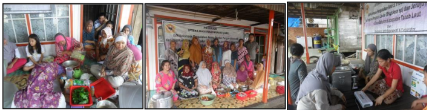
Gambar 3. Kegiatan Pembuatan Produk Olahan dari Mangrove

Tujuan dari kegiatan pelatihan pembuatan produk olahan dari mangrove untuk mengenalkan buah mangrove sebagai pengganti tepung dan produk diversifikasi lainnya seperti kue, sirup, permen, dodol, dan selai serta kerupuk dan kripik dan sesuai dengan strategi pemasaran yang telah dilakukan dalam pelatihan, maka produk yang di kenalkan secara segmentasi sebagai sasaran kelas menengah yang higienis dan aman secara kesehatan sebagai jajanan pasar. Daya tahan produk olahan mangrove dan tepungnya hampir tidak ada bedanya dengan produk olahan pabrikasi lain yang beredar di warung dan kios sekitar desa Batakan. Tanpa menambahkan pewarna makanan, pengawet makanan berupa asam benzoat ataupun zat antioksidan yang kurang aman bagi tubuh. Proses pengemasan dan penyimpanan yang bagus dengan disimpan dalam kondisi di vacum (hampa udara) dapat memperpanjang daya tahan produk.