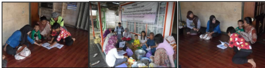
Gambar 1. Suasana Kegiatan Penyuluhan Aneka Produk Pangan Mangrove

Materi pelatihan keterampilan pengolahan aneka produk pangan berbahan mangrove sebagai alternatif pangan saat musim panceklik/pancaroba disertai perhitungan ekonomis, pemilihan/sortasi mangrove yang digunakan, pembuatan aneka produk dan dan motivasi usaha. Tahapan kegiatan pelatihan keterampilan ini juga memberikan demonstrasi kegiatan pengolahan produk pangan berbahan mangrove untuk pengganti tepung. Respon mitra dari hasil diskusi kegiatan sosialisasi di ke-3 lokasi sesuai dan dianggap mampu mengatasi permasalahan mitra dan bertujuan untuk mentransfer ilmu pengetahuan dan teknologi tentang pengolahan aneka produk pangan.