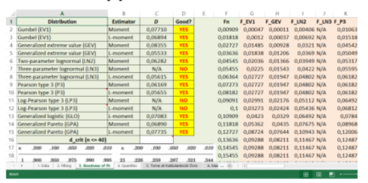
Gambar 3 Tahap pengujian kesesuaian