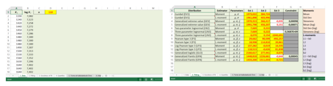
Gambar 1 Tahap pemasukan data