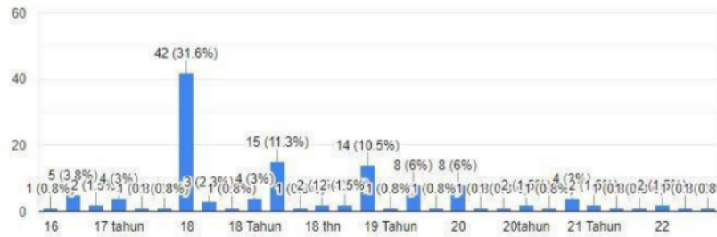
Gambar I. Klasifikasi Suku Pemilih Muda