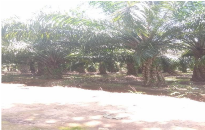
Gambar 2. Perkebunan Sawit mandiri

Menurut Mardikanto 1993, bahwa kelompok tani dapat dijadikan wadah untuk berkomunikasi dan penerima informasi dari luar dan sebagai tempat berdiskusi, karena didalam kelompok terjadi interaksi antara anggota kelompok tani berdiskusi dan saling berinteraksi adalah metode penyuluhan yang baik, karena memberikan kesempatan untuk saling mempengaruhi sesama anggota dalam kelompok. Seperti adanya salah satu anggota kelompok memiliki informasi suatu inovasi yang dapat meningkatkan kemajuan sesama anggota kelompok.