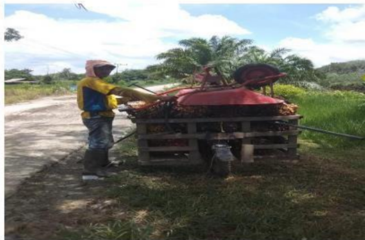
1 Gambar 3. Petani Mandiri

Desa sidomulyo kecamatan Wanaraya Kabupaten Barito Kuala merupakan wilayah yang dihuni sebagian besar transmigran yang berasal dari pulau Jawa. Masyarakat Jawa sangat menjunjung tinggi kejujuran. Kejujuran pun tidak datang dari luar, tetapi bisikan kalbu yang terus menerus mengetuk dan membisikkan nilai moral yang luhur. Kejujuran bukanlah sebuah keterpaksaan, melainkan sebuah panggilan dari dalam sebuah keterikatan. Selain itu masyarakat Jawa juga memiliki komitmen yang tinggi. Komitmen dengan keyakinan yang mengikat sedemikian kukuhnya sehingga terbelenggu seluruh hati nuraninya dan kemudian menggerakkan perilaku menuju arah tertentu yang diyakininya. Dalam komitmen tergantung sebuah tekad, keyakinan, yang melahirkan bentuk vitalitas yang penuh gairah. Prinsip hidup yang kuat dengan pendirian (konsisten) adalah suatu kemampuan untuk bersikap taat asas, pantang menyerah, dan mampu mempertahankan prinsip walau harus berhadapan dengan resiko yang membahayakan dirinya. Mereka mampu mengendalikan diri dan mengelola emosinya secara efektif.