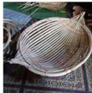
Gambar 2. Alat tradisional untuk mendulang berlian