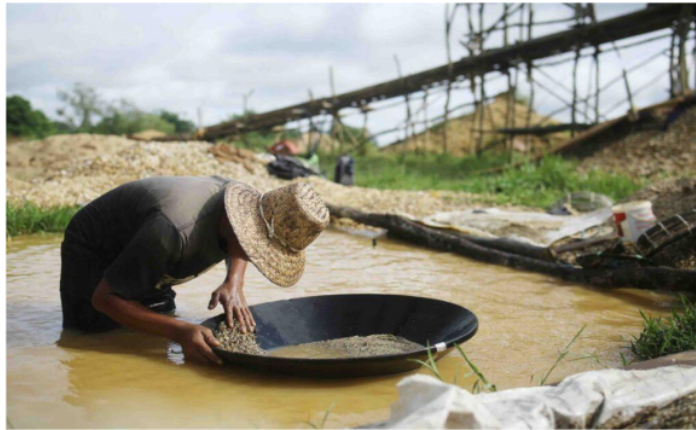
Gambar 3. Aktivitas Pendulangan Berlian

Dalam pendulangan berlian di Kalimantan Selatan, cara kerja tradisional juga mempengaruhi sistem pembagian hasil. Para penambang mendapatkan hasil dengan menggunakan metode tradisional pasang surut dengan cara yang berbeda. Pada saat air surut dan pasang, semua biaya ditanggung bersama antara sesama penambang dan dibagi rata. Demikian juga dengan hasil bersih yang diperoleh dibagi rata di antara para pendulang berlian yang bekerja. Namun, pada aspek modal kerja, semua biaya disediakan atau ditanggung oleh beberapa pihak yang terlibat selama bekerja mendulang berlian di setiap wilayah yang dikuasainya (Ramadhana & Juhadi, 2021). Biaya-biaya tersebut meliputi seluruh pengadaan fasilitas dan biaya hidup pendulang, yang diperlakukan selama pendulangan berlangsung. Dalam satu kali pembagian hasil pendulangan berlian, banyak unsur yang dipertimbangkan