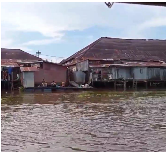
Gambar 1. Jamban Apung di DAS Martapura Banjarmasin

Martapura. Adanya aktivitas pertambangan liar, intan, batubara dan emas di Kabupaten Banjar menambah deret panjang penyebab rusaknya kualitas air pada sungai Martapura.