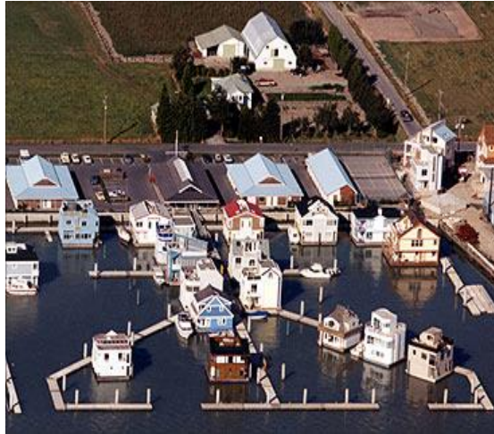
Gambar 3. Konsep Waterfront City