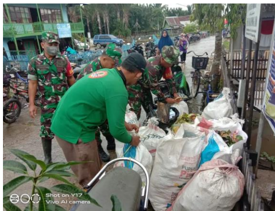
Gambar 4. Pengelolaan Sampah, Program Sungai Martapura Bungas

Pengendalian masalah pencemaran air dimulai dari strategi perubahan persepsi masyarakat terkait pencemaran sungai. Strategis yang dapat dilakukan agar dapat mengubah persepsi masyarakat yang belum peduli terhadap pengelolaan limbah khususnya rumah tangga yakni adalah melakukan sosialisasi, dan membuat regulasi, pembinaan dan pengawasan dan melakukan pelatihan dalam pengelolaan sampah.