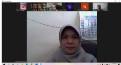
Gambar 2 Narasumber dua sedang Menyampaikan Materi Pelatihan

Para peserta kegiatan pelatihan memahami dan menguasai langkah-langkah dalam menulis artikel jurnal terindeks Scopus. Hal ini setelah mereka menerima materi dari narasumber dua. Dokumentasi kegiatan terdapat pada Gambar 2.