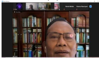
Gambar 3 Narasumber tiga sedang Menyampaikan Materi Pelatihan

Para peserta kegiatan pelatihan memahami dan menguasai tentang penggunaan bahasa dalam artikel ilmiah. Hal itu setelah mereka menerima penjelasan dari narasumber tiga. Narasumber tiga menyampaikan materi tentang Penggunaan Bahasa dalam Artikel Ilmiah. Dalam paparannya, penyuluh memfokuskan materi terkait dengan menyusun kalimat efektif dan penyusunan paragraf yang koheren dan kohesif. Narasumber tiga menyampaikan materi tentang kalimat efektif dan syarat-syaratnya. Syarat kalimat efektif adalah kesepadanan, kepararelan, ketegasan, kehematan, kepaduan, dan kelogisan. Dokumentasi terdapat pada Gambar 3.