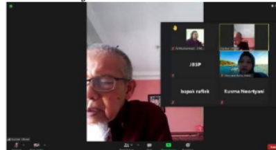
Gambar 4 Narasumber empat sedang Menyampaikan Materi Pelatihan

Para peserta pun memahami dan dapat menguasai tentang ide penelitian lokalitas (Banjar) yang disampaikan oleh narasumber empat. Narasumber empat menyampaikan materi ide penelitian bahasa berbasis lokalitas (Banjar). Dalam paparannya, beliau menyampaikan tentang kajian morfologi dalam bahasa Banjar. Lebih lanjut, beliau paparkan tentang proses afiksasi, reduplikasi, dan komposisi atau kompositum dalam bahasa Banjar.