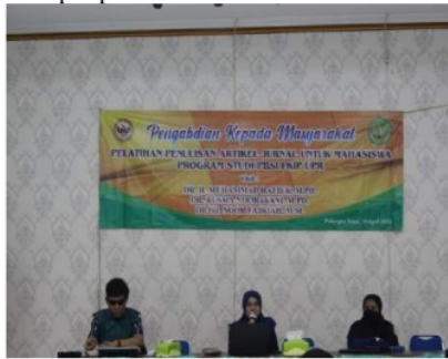
Gambar 2 Penyampaian Materi Kedua

Pemateri kedua memaparkan tentang sistematika penulisan artikel jurnal. Pada saat pemaparan, pemateri kedua secara terstruktur dan sistematis menyampaikan materi berkaitan dengan 1) membuat pola dalam sebuah gagasan penulisan; 2) melakukan penelitian terkait dengan gagasan yang sudah ditulis; 3) membentuk sebuah kerangka atau desain yang ditulis; 4) memulai menulis sebuah artikel; 5) membuat penyelesaian dalam tulisan; dan 6) memberikan tips dalam menulis artikel. Materi pertama membentuk gagasan penulisan dilakukan dengan: a) mengenali jenis artikel yang akan ditulis; b) mempertimbangkan topik secara berulang; c) memilih topik sesuai bidang; d) melaksanakan observasi awal; e) menemukan sisi tulisan menjadi unik; dan f) mempertajam suatu argumentasi. Pemateri kedua sedang menyampaikan materi dalam pelatihan ini. Dokumentasi terdapat pada Gambar 2.