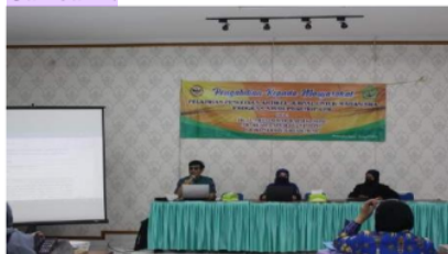
Gambar 1 Penyampaian Materi Pertama

Pelatihan penulisan artikel jurnal ini dimulai dengan pemaparan materi oleh pemateri pertama mengenai cara menulis artikel hasil penelitian bahasa dan sastra yang baik dan berkualitas. Pemateri pertama sedang meny 15 paikan materi pelatihan. Dokumentasi dapat dilihat pada Gambar 1.