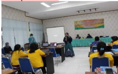
Gambar 3 Penyampaian Materi Ketiga

Materi terakhir dalam kegiatan ini adalah pengenalan mengenai aplikasi Mendeley yang bermanfaat untuk pengelolaan daftar Pustaka dan sitasi secara otomatis. Ada enam tahapan yang dilakukan sehingga mahasiswa dapat menggunakan aplikasi Mendeley dalam artikel ilmiahnya. Tahapan-tahapan tersebut langsung dipraktikkan oleh pemateri. Tahap pertama, adalah bagaimana caranya peserta mempunyai akun Mendeley . Caranya dengan membukasisitus web Mendeley dilanjutkan klik create a free account dan memasukkan email masing-masing pada kolom yang tersedia setelah itu klik continue . Isi nama depan, nama belakang dan password pada kolom yang tersedia dan klik register dan continueto Mendeley . Pemateri ketiga sedang menyampaikan materi pelatihan. Dokumentasi dapat dilihat pada Gambar 3.