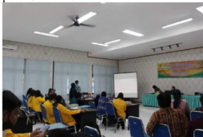
Gambar 5 Peserta sedang Mengikuti Pemaparan Materi PKM

Pelatihan yang diselenggarakan merupakan paket lengkap tidak hanya materi Mendeley tetapi juga bagaimana menulis dan sistematika penulisan artikel ilmiah tetapi untuk memaksimalkan kejelasan peserta mengenai Mendeley maka perlu pelatihan khusus. Beberapa yang pelatihan khusus membahas Mendeley maka memang akan meningkatkan pengalaman peserta (Sari, 2022; Sudirman et al., 2021). Para peserta sedang mengikuti penyampaian materi dari pemateri. Dokumentasi disajikan pada Gambar 5.