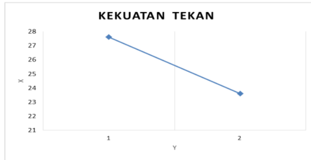
Gambar 1. Kekuatan Tekan Sejajar Serat

Keteguhan lengkung statis (MOE) adalah sifat mekanik dari suatu kayu. Keteguhan lengkung statis yaitu suatu kekuatan menahan sutau kayu dari lengkung yang diakibatkan oleh beban hidup ataupun beban mati dari suatu objek (Dumanauw, 1990). Tegangan lentur patah (MOR) adalah sifat mekanis yang memiliki kaitan dengan kekuatan kayu yang dimana kekuatan menahan beban luar yang dapat cenderung dapat mengubah bentuk dari kayu tersebut (Kollman dan Cote, 1968), yakni dengan arti lain MOR adalah suatu sifat yang dimana sebagai penentu beban suatu objek yang dapat di tempa pada kayu (Iswanto, 2008).