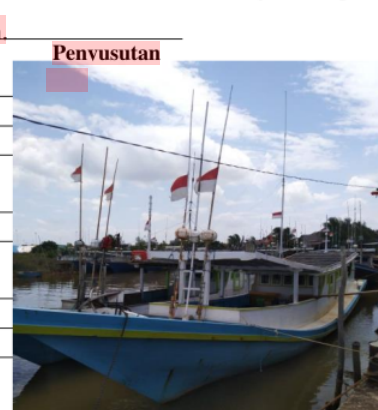
Gambar 12. Armada Penangkapan Nelayan

Komponen terbesar untuk biaya investasi ini adalah biaya pembelian kapal yaitu sebesar 56,54% dari total biaya investasi. Terbesar kedua adalah alat tangkap yaitu sebesar 35,66% dari total investasi kemudian yang ketiga adalah mesin yaitu sebesar 6,47% sedangkan 1,33% merupakan biaya investasi untuk pembelian aki, tong ikan dan lampu.