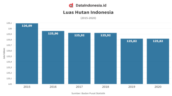
Gambar 1. Luas Kawasan Hutan Indonesia

Badan Pusat Statistik (BPS) mencatat, luas kawasan hutan