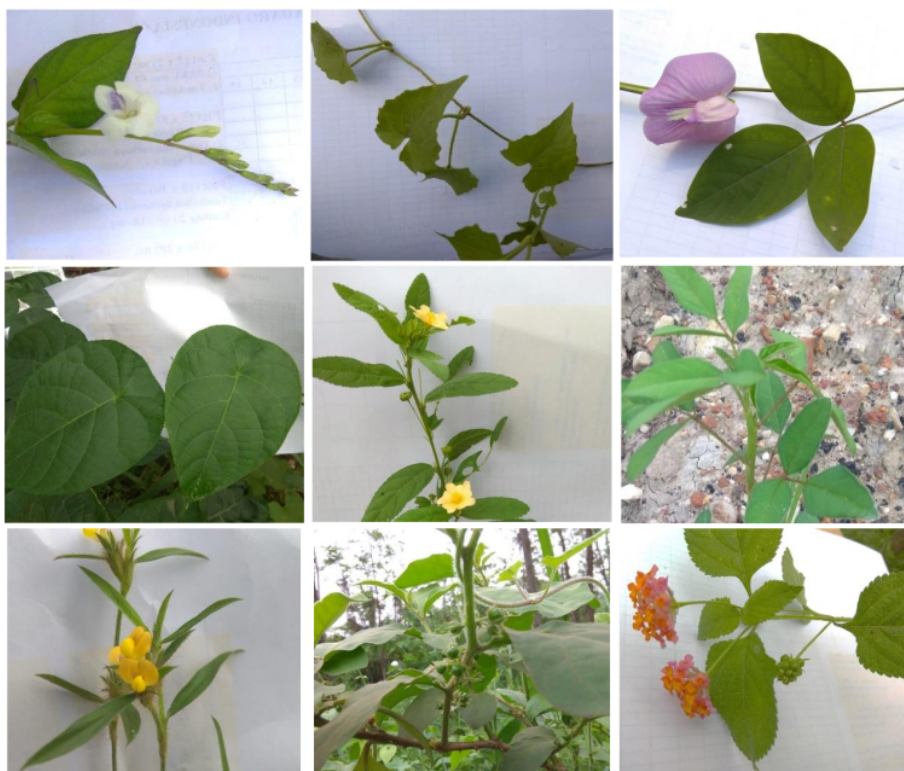
Gambar 1. Beberapa spesies herba-liana di area reklamasi PT Adaro Indonesia (mulai baris atas dari kiri ke kanan: Asystasia gangetica , Mikania micrantha , Centrosema pubescens , Merremia peltata , Sida rhombifolia , Crotalaria pallida , Stylosanthes scabra , Solanum torvum , dan Lantana camara )

Indeks keragaman spesies tumbuhan herba-liana tertinggi terjadi pada Lokasi 1, sedangkan terendah pada Lokasi 3. Bila dihitung dari tahun tanam, Lokasi 1 berumur sekitar 2 tahun dan Lokasi 3 berumur sekitar 5 tahun. Tampak bahwa semakin tinggi umur revegetasi, semakin rendah indeks keragaman spesies tumbuhan bawah, khususnya herba-liana (Gambar 2). Riswan et al. (2015) melaporkan bahwa semakin tinggi umur reklamasi pascatambang, semakin berkurang jumlah spesies semak. Purnomo et al. (2018) melaporkan bahwa semakin tinggi prosentaseutupan tajuk, semakin berkurang keragaman jenis tumbuhan bawah. Walaupun temuan di PT Adaro Indonesia sesuai dengan laporan Riswan et al. (2015) dan Purnomo et al. (2018), penelitian perlu dilanjutkan karena kisaran umur revegetasi masih sempit, yaitu antara 2 — 5 tahun.