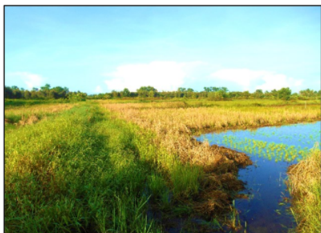
Gambar 1. Kawasan rawa Desa Sungai Lumbah Kabupaten Barito Kuala.