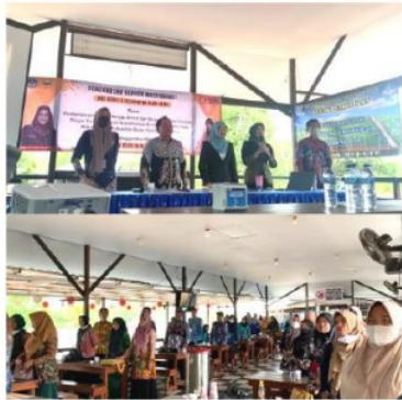
Gambar 3 Kegiatan Pengabdian Hari Kedua

Program pengabdian dalam bentuk pelatihan pengembangan bahan ajar berbasis muatan lokal dalam implementasi kurikulum merdeka berdampak positif terhadap minat, dan meningkatnya pemahaman peserta pelatihan secara keseluruhan. Selain itu hal tersebut juga memberikan dampak pada terdorongnya peserta untuk belajar secara aktif dan menyenangkan (Budi Permana & Pujiastuti, 2017; Norhayati et al. , 2019; Samiha, 2020). Hasil dari PKM ini menunjukkan adanya ketertarikan para KKG Kecamatan Aluh-aluh untuk mempelajari aplikasi