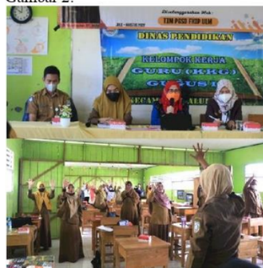
Gambar 2 Kegiatan Pengabdian Hari Pertama

Salah satu peserta ikut aktif dalam kegiatan. Semua peserta sangat senang dengan adanya pelatihan menggunakan aplikasi Canva. Aplikasi Canva sangat mudah sehingga semua peserta dapat mengunduh dengan gawai peserta masing-masing dapat dilihat pada Gambar 2.