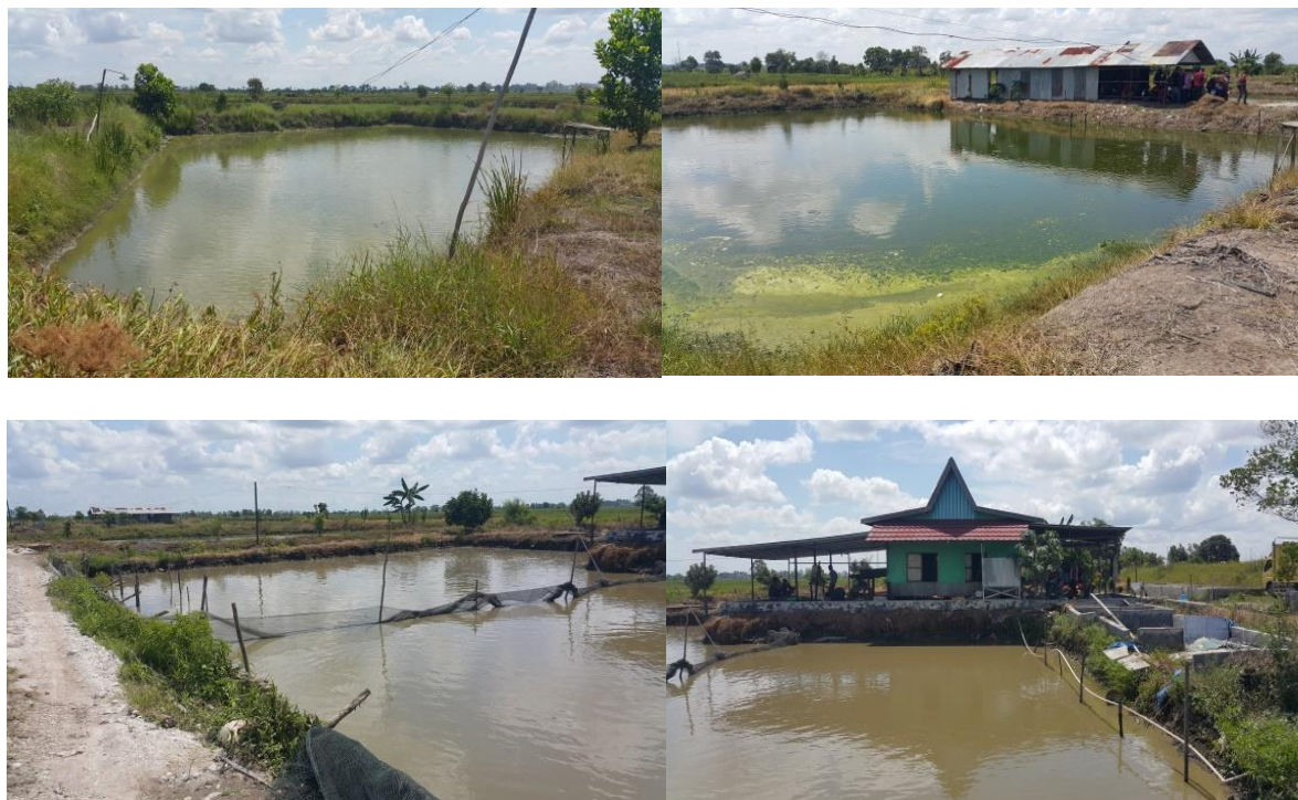
Gambar 1. Usaha budidaya di Kawasan Minapolitan Kabupaten Banjar

kekuatan yang masih dapat diandalkan untuk meningkatkan perekonomian karena usaha budidaya ikan menyediakan lapangan kerja. efisiensi dan fleksibilitasnya terbukti menjadi kekuatan untuk tetap bertahan hidup dan usaha budidaya ikan sebagai sumber penghasil entrepreneur baru.