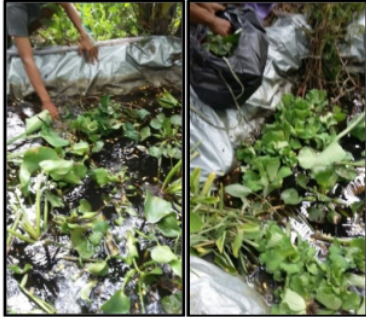
Gambar 1. Penempatan sementara tanaman air di dalam kolam sementara.

Di setiap sisi kotak bambu diberi paranet yang digantung pemberat, agar tanaman tidak dapat keluar jauh dari kotak bambu. Peralatan lain yang digunakan adalah linggis dan atau cangkul untuk membuat lubang penanaman bagi tanaman di tepian void. Penanaman dilakukan secara acak dan bercampur antara semua jenis tanaman.