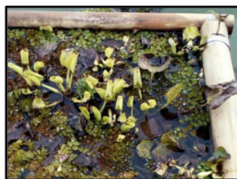
Gambar 3. Tanaman enceng gondok dengan pertumbuhan tertekan

Hasil pengamatan terhadap tanaman air adalah secara keseluruhan pertumbuhan tanaman terhambat dengan indikasi kematian dan kecenderungan berwarna kuning kecoklatan sampai kehitaman, bagian tubuhnya mengecil (kerdil). Beberapa indikasi ini menunjukkan bahwa komunitas tumbuhan air aktif menyerap senyawa beracun. Tanaman yang mati akan tenggelam ke dasar perairan bersama bahan/senyawa beracun yang terikat organik di bagian tanaman (Gambar 2 dan Gambar 3).