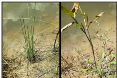
Gambar 4. Tanaman purun tikus dan bamban di tepian void

Tanaman air lain yang ditanam di tanah yang berbatasan dan terendam perairan void adalah purun tikus ( Eleocharis dulcis ) dan tanaman bamban ( Donax camiformis ). Persentase tumbuh kedua tanaman ini di atas 95%. Kenampakan penotifik kedua tanaman ini dilingkungan void terdeskripsi pada Gambar 4.