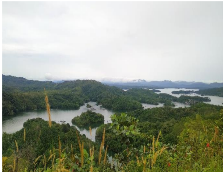
Gambar 2. Bukit Matang Kaladan

Bukit Matang Kaladan merupakan sebuah bukit yang terletak di Desa Tiwingan Lama, Kecamatan Aranio, Kabupaten Banjar, Kalimantan Selatan. Bukit Matang Kaladan mulai ramai dikunjungi wisatawan dan dikenal sejak tahun 2015. Pemandangan yang sekilas menyerupai Raja Ampat sehingga sempat ramai menjadi perbincangan dan viral di media sosial. Pemandangan bendungan Riam yang membendung delapan sungai pegunungan meratus membuat keindahan panorama pemandangan bukit yang indah.