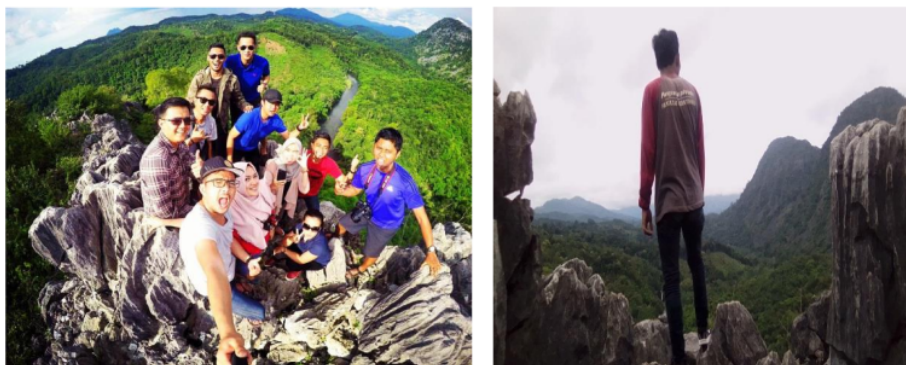
Gambar 2. Keindahan wisata alam Bukit Langara

Amandit, hutan, gunung, flora, fauna dan sunrise dan sunset , sehingga wisatawan dapat melihat dan merasakan keindahan yang berada di obyek wisata Bukit Langara. Sebelum melakukan pendakian pengunjung melewati kebun karet masyarakat serta pepohonan yang tumbuh di sekitar Bukit Langara. Keindahan obyek wisata Bukit Langara dapat dilihat pada Gambar 2.