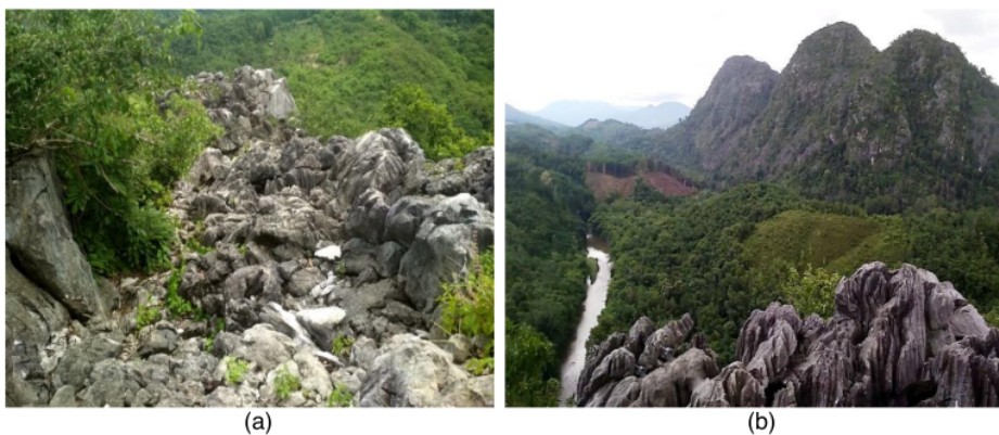
Gambar 1. (a) Batuan Bukit Langara, (b) Panorama Landscape Bukit Langara

Kriteria atraksi alam Bukit Langara berdasarkan rating adalah Sungai, Gunung, Hutan dan Keanekaragaman Fauna dengan nilai rating 5 (sangat menarik) sedangkan keanekaragaman flora nilai rating 4 (menarik dan relatif alami). Panorama Landscape Bukit Langara bisa dilihat pada Gambar 1.