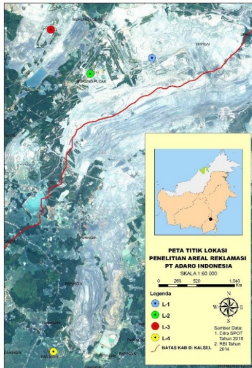
Gambar 1. Empat Lokasi Sampel di Area Revegetasi PT Adaro Indonesia, Kalimantan Selatan