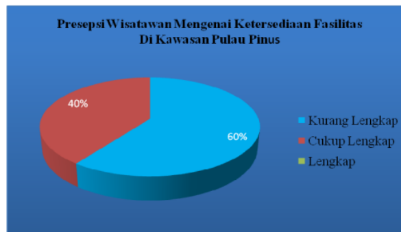
Gambar 3. Persepsi wisatawan mengenai ketersediaan fasilitas

Sebagian besar wisatawan (60 %) menyatakan bahwa fasilitas wisata yang ada di kawasan Pulau Pinus kurang lengkap. Berdasarkan pengamatan di areal wisata fasilitas wisata yang tersedia masih sangat minim, oleh sebab itu perlu penambahan fasilitas lain seperti shelter atau tempat duduk, penginapan, toko penjualan cinder mata, tempat bermain anak, musholla dan fasilitas warung makan dan minum. Menurut Lascurain (1993) fasilitas fisik yang memadai di dalam dan di dekat kawasan wisata diperlukan untuk pengembangan yang efektif. Kriteria perencanaan, perancangan dan pembangunan yang tepat harus diterapkan meminimalkan dampak