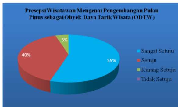
Gambar 4. Persepsi wisatawan mengenai pengembangan Pulau Pinus sebagai Obyek Daya Tarik wisata (ODTW).

Persepsi wisatawan mengenai pengembangan Pulau Pinus sebagai Obyek Daya Tarik wisata (ODTW) dapat dilihat pada gambar di bawah ini :