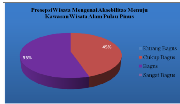
Gambar 2. Persepsi wisatawan mengenai aksesibilitas menuju Kawasan Wisata Alam Pulau Pinus

Secara deskriptif hasil wawancara tentang aksesibilitas menuju kawasan wisata alam Pulau Pinus Riam Kanan dapat dilihat pada gambar berikut :