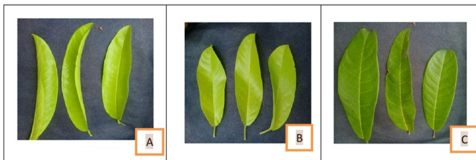
Gambar 4. Daun sebagai pakan ulat

Pergantian daun dilakukan selama satu minggu sekali ini bertujuan agar dapat melihat seberapa besar ulat dalam memakan daun serta saat daun sudah mulai layu, untuk perlakuan B (daun sedang) dan C (daun tua). Berikut merupakan gambaran dari daun muda, daun sedang, daun tua, dapat dilihat pada Gambar 4 sebagai berikut: