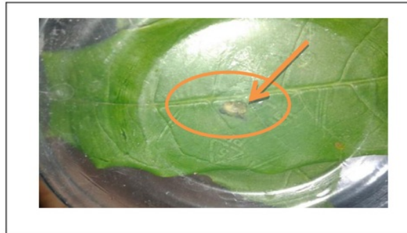
Gambar 3. Ulat memakan daun.

Hasil dari pengamatan proses kecepatan makan daun ini diletakkan dalam toples dengan jumlah ulat masing-masing satu di dalamnya. Proses ulat memakan daun banyak terjadi pada malam hari, biasanya ulat memakan daun muda karena daun yang masih muda terdapat lapisan epidermis sehingga ulat dapat memakan lapisan epidermis tersebut. Daun yang dijadikan pakan pada percobaan ini diambil langsung dari pohon, sehingga daun masih segar. Pertambahan bobot badan ulat dengan pemberian pakan alami lebih tinggi dari pada pemberian pakan buatan karena pada pakan alami daun masih segar baru dipetik dari pohonnya sehingga dapat dilihat pada Gambar 3 sebagai berikut: