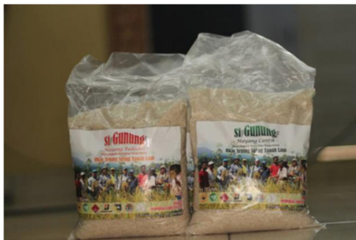
Gambar 4. Beras Si Gunung Varian Mayang Cantik dan Mayang Badadai

Pengelolaan lahan sebagai tempat bertani memang memerlukan modal atau biaya untuk bisa memulai bertani atau bercocok tanam. Sehingga masyarakat harus mengeluarkan biaya terlebih dahulu untuk memulai kemudian saat hasil panen didapat barulah kita mengetahui apakah bercocok tanam dapat menguntungkan masyarakat. Sebenarnya hasil usaha agroforestri di lahan HKM Tebing Siring beragam, namun dalam penelitian ini dibatasi dari produksi Padi Gunung yang telah dipanen, dan diolah menjadi beras dengan merk Si Gunung dengan Varian Mayang Cantik dan Mayang Badadai . Beras gunung yang telah dikemas dapat dilihat pada Gambar 4.