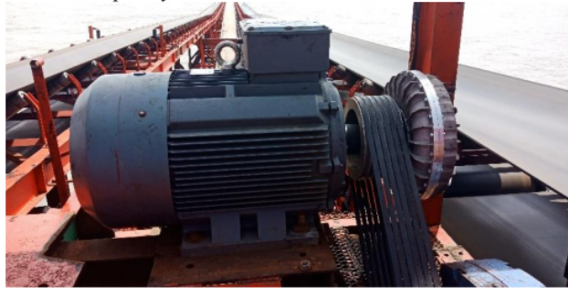
Gambar 10. Motor Penggerak

Motor penggerak yang digunakan berjenis motor listrik guna mengoperasikan drive pulley .