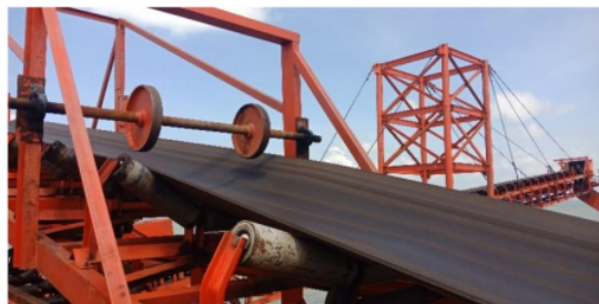
Gambar 8. Belt

Belt merupakan peralatan utama pemindah material conveyor seperti pada Gambar 8.