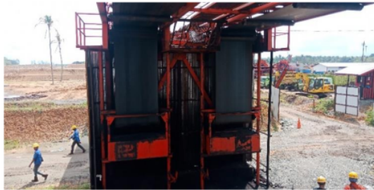
Gambar 7. Take Up Pulley

Take up pulley berguna untuk pengencang belt , mengontrol biar kekencangan belt kurang lebih dari bagian bermuatan diatas dan bagian tak bermuatan dibawah, yang seketika memperpanjang jarak head pulley ke tail pulley , bias dilihat di Gambar 7.