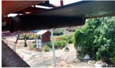
Gambar 3. Return Roll