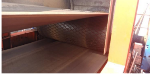
Gambar 6. Head Pulley

yakni pulley terhubung langsung bersama gearbox langsung terkoneksi Bersama motor listrik. fungsi Head pulley ini iyalah tenaga pertama siklus belt conveyor , seperti terlihat pada Gambar 6.