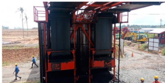
Gambar 5. Bend Pulley

Bemd Pullay yakni pullay penyambung maupun membelokan belt mengarah take up pulley maupun pulley pemberat. Bend pulley seperti terlihat pada Gambar 5.