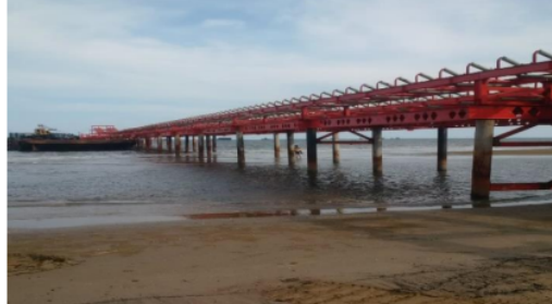
Gambar 9. Frame

Frame atau galeri dibangun dari bangunan baja seperti pada Gambar 9. Berguna menampung semua kerangka belt conveyor . Frame dibangun sedemikian rupa biar menguatkan belt bisa melintas stabil diatasnya tanpa gangguan.