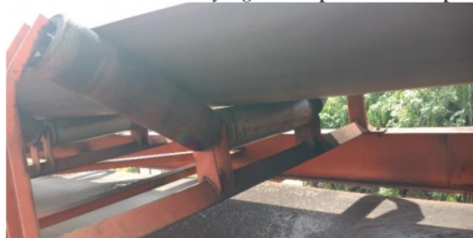
Gambar 4. Carrying Roll

Carrying Roll berguna untuk menumpu belt conveyor yang berisi material yang di bawa diatasnya. Tidak sama dengan return roll , carrying roll terbagi tiga macam roll tersebut yakni landasan, dimana roll tengah diposisikan mendatar dan roll samping kiri dan kanan diposisikan miring buat menjaga biar material tetap pada posisi tumpukannya untuk menghindari tumpahan. Dari permasalahan diatas, jadi jarak dari titik landasan carrying roll lebih dekat ketimbang return roll fungsinya menghindari lengkungan belt dikarenakan pengaruh berat material dibawa. Carrying roll seperti terlihat pada Gambar 4 .