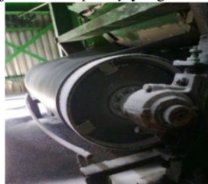
Gambar 2. Tail Pulley

Pulley tail atau Belt conveyor berotasi mengiringi head pulley , berguna sebagai tempat utama perputarnya belt conveyor mengarah return roll . Tail pulley lazimnya melambangkan tempat terujung oleh suatu pemindahan material. Gambar 2 menunjukkan Tail pulley yang ada di Belt conveyor .