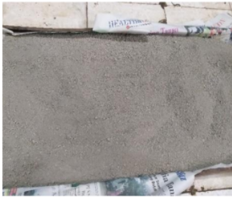
Gambar 2. Claystone Setelah Dihaluskan

Pengujian kuat tekan paving block dilakukan pada umur 7 dan 28 hari. Hasil dari pengujian kuat tekan dapat dilihat pada Gambar 1 s.d. Gambar 2.