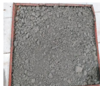
Gambar 1. Claystone Sebelum Dihaluskan

Pada pemeriksaan material claystone didapat persentase kadar air yang terkandung sebesar 3,37%. Kadar air sangat penting untuk diketahui, terutama dalam menentukan banyaknya air yang akan digunakan dalam pencampuran. Pemeriksaan kadar organik pada claystone dilakukan dengan cara melihat perubahan warna dengan menambahkan larutan Natrium Hidroksida (NaOH) 3% dan didiamkan selama 24 jam. Setelah didiamkan selama 24 jam, claystone termasuk dalam klasifikasi warna bening (No. 1) atau tidak mengandung bahan organik. Pemeriksaan kadar organik berguna untuk mengetahui kandungan bahan organik yang terdapat di dalam claystone , karena bahan organik dapat mengurangi kekuatan paving block . Pada pemeriksaan analisa saringan, claystone dapat dikategorikan ke dalam zona 1 (kasar). Pemeriksaan analisa saringan berguna untuk menentukan gradasi dari agregat.