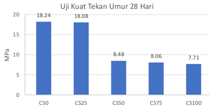
Gambar 2. Hasil Uji Kuat Tekan Rata-Rata Sampel Pada Umur 28 Hari

tanpa campuran claystone memiliki nilai kuat tekan tertinggi sebesar 16,90 MPa. Pada benda uji CS25, CS50, CS75, dan CS100 terdapat penurunan kekuatan masing-masing sebesar 25,97%, 62,78%, 66,09%, dan 69,28% dibandingkan dengan benda uji CS0.