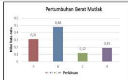
Gambar 2. Diagram Berat Mutlak

Pada diagram batang diatas dapat dilihat bahwa perlakuan A dan B memiliki pertumbuhan panjang dan berat mutlak paling spesifik dan besar, yang dimana pada perlakuan A dilakukan percobaan Artemia 50%+ Kuning telur bebek 50% memiliki panjang mutlak sebesar 33 mm dan berat mutlak sebesar 0,48 gram, pada hasil yang paling besar yaitu perlakuan B dilakukan percobaan Artemia 70%+ Kuning telur bebek 30% memiliki panjang mutlak sebesar 38 mm dan berat mutlak sebesar 0,31 gram.