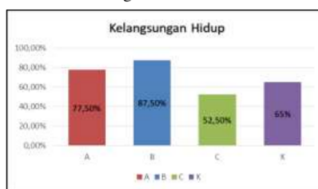
Gambar 3. Diagram kelangsungan hidup larva

kualitas air sangat berpengaruh pada kelangsungan hidup, kualitas air memiliki pengaruh terhadap metabolis larva ikan biasanya dengan memperkirakan dengan mengukur jumlah oksigen yang diperoleh larva ikan setiap persatuan waktu. Kemungkinan hal ini terjadi karena adanya oksidasi/reaksi dimana suatu zat mengikat oksigen, pada bahan makanan yang memang memerlukan oksigen.