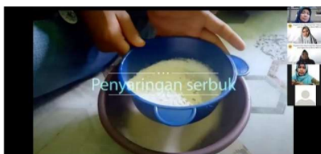
Gambar 3. Dokumentasi Kegiatan Pengabdian Saat Menampilkan Video secara online

Bahan alam yang mudah ditemukan dan telah diketahui khasiatnya. Oleh sebab itu, dalam pengabdian ini menggunakan tanaman jahe, kunyit mangga dan temulawak sebagai contoh cara pembuatan obat tradisional.