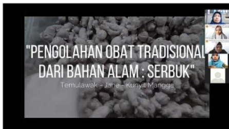
Gambar 2. Dokumentasi Kegiatan Pengabdian Saat Menampilkan Video secara online

Video yang ditayangkan dalam kegiatan pengabdian berisi pengenalan alat & bahan, proses pembuatan obat tradisional. Jenis obat tradisional yang dicontohkan dalam video yakni jamu dalam bentuk sediaan serbuk. Dokumentasi kegiatan pengabdian saat menayangkan video dapat dilihat pada gambar 2 dan 3.