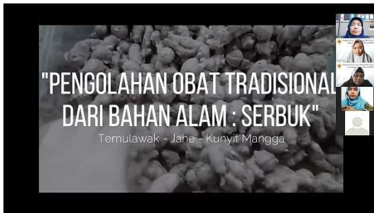
Gambar 2. Dokumentasi Kegiatan Pengabdian Saat Menampilkan Video secara online

Video yang ditayangkan dalam kegiatan pengabdian berisi pengenalan alat & bahan, proses pembuatan obat tradisional. Jenis obat tradisional yang dicontohkan dalam video yakni jamu dalam bentuk sediaan serbuk. Dokumentasi kegiatan pengabdian saat menayangkan video dapat dilihat pada gambar 2 dan 3.