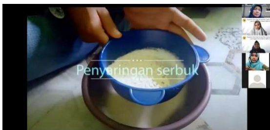
Gambar 3. Dokumentasi Kegiatan Pengabdian Saat Menampilkan Video secara online

Bahan alam yang mudah ditemukan dan telah diketahui khasiatnya. Oleh sebab itu, dalam pengabdian ini menggunakan tanaman jahe, kunyit mangga dan temulawak sebagai contoh cara pembuatan obat tradisional.