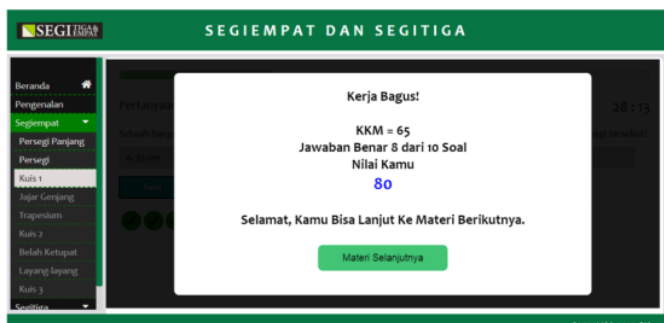
Gambar 4. Hasil skor hasil pengerjaan kuis

Gambar 3. Merupakan halaman kuis dan pada halaman ini adalah penekanan dari penerapan metode tutorial dalam media. Materi selanjutnya yang masih berwarna abu-abu pada navigasi adalah materi yang belum dapat diakses. Kuis ini berfungsi untuk membuka akses ke materi selanjutnya. Akses ke materi selanjutnya akan terbuka ketika skor tes hasil belajar memperoleh nilai minimal kkm yang telah ditentukan.