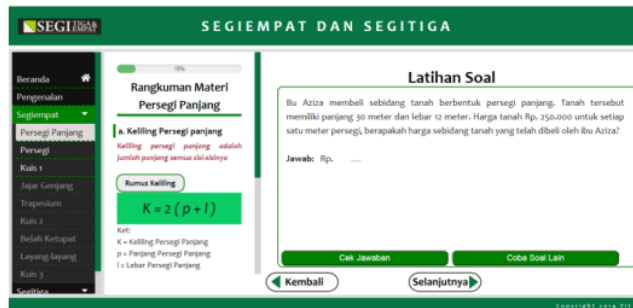
Gambar 2. Halaman latihan

Tahap pengembangan merupakan realisasi media pembelajaran dari rancangan flowchart, storyboard, dan desain konten media yang telah divalidasi pada tahap sebelumnya. Media yang telah selesai dikembangkan kemudian diuji validitasnya terlebih dahulu sebelum diujikan di sekolah. Berikut hasil dari media yang dikembangkan.