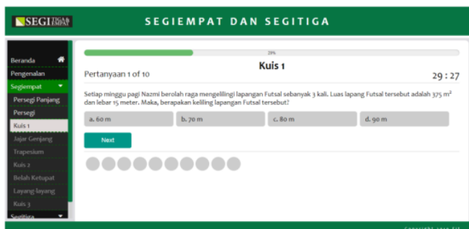
Gambar 3. Halaman kuis

Gambar 3. Merupakan halaman kuis dan pada halaman ini adalah penekanan dari penerapan metode tutorial dalam media. Materi selanjutnya yang masih berwarna abu-abu pada navigasi adalah materi yang belum dapat diakses. Kuis ini berfungsi untuk membuka akses ke materi selanjutnya. Akses ke materi selanjutnya akan terbuka ketika skor tes hasil belajar memperoleh nilai minimal kkm yang telah ditentukan.