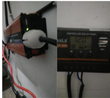
Gambar 1.5. Pemasangan instalasi panel surya di Mushola Nurul Hikmah