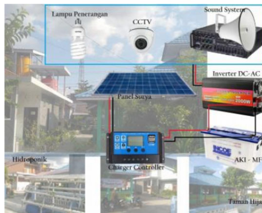
Gambar 1.3. Skema Teknologi Energi Terbarukan berbasis Sel Surya

power supply CCTV, Sound System, dan Pompa Hidroponik Sementara sumber energi listrik cadangan berasal dari PLN dan Genset di Mushola Nurul Hikmah. Teknologi ini diharapkan dapat membantu mengatasi permasalahan di Mushola Nurul Hikmah. Alat ini terdiri dari Sel Surya, Solar Charger Controller, Inverter, MCB, dan Aki Maintenance Free. Seperti yang ditunjukkan pada Gambar 1.3.