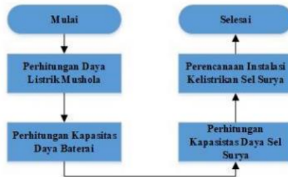
Gambar 1.1. Perencanaan Teknologi Sel Surya

Perencanaan teknologi sel surya terdiri dari beberapa tahapan yang perlu untuk dilakukan. Adapun dari perencanaan ini ditunjukkan pada gambar 1.1.