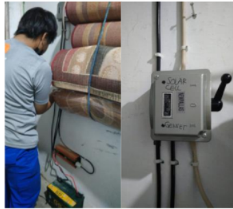
Gambar 1.4. Pemasangan instalasi panel surya di Mushola Nurul Hikmah