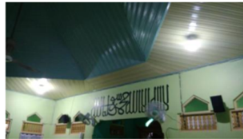
Gambar 1.6. Uji coba penyalaaan lampu hasil instalasi panel surya di Mushola Nurul Hikmah