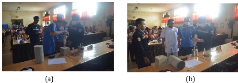
Gambar 5. Praktek penggunaan alat uji Schmidt hammer Test kepada Mitra

Penggunaan alat Schmidt Hammer Test dilakukan secara demonstratif pada peserta pelatihan yaitu siswa dan tenaga pendidik SMKN 2 Banjarbaru di Lokasi kegiatan pelatihan. Praktek pengujian oleh tenaga pendidik dan siswa dapat dilihat pada Gambar 5.