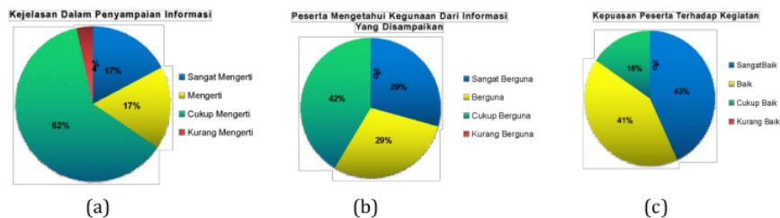
Gambar 6. Hasil survei evaluasi kegiatan sosialisasi

dikarenakan rata-rata peserta adalah siswa kelas X dimana materi beton yang diberikan di sekolah masih minim. Adapun persentase peserta mengetahui kegunaan informasi yang disampaikan, hasilnya menunjukkan 42% cukup berguna, 29% menyatakan berguna dan 29% sangat berguna. Tidak ada peserta yang menyatakan kurang berguna. Untuk kepuasan peserta masing-masing 43%, 41%, dan 16% menyatakan kegiatan sangat baik, baik, dan cukup baik secara berurutan. Berdasarkan hasil survey tersebut, maka disimpulkan kegiatan sosialisasi berjalan dengan baik dan memberikan informasi yang berguna bagi peserta.