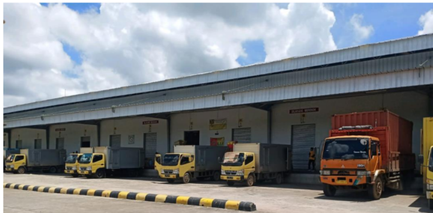
Gambar 1. Lokasi bongkar muat dengan jenis perkerasan beton ( rigid pavement ).