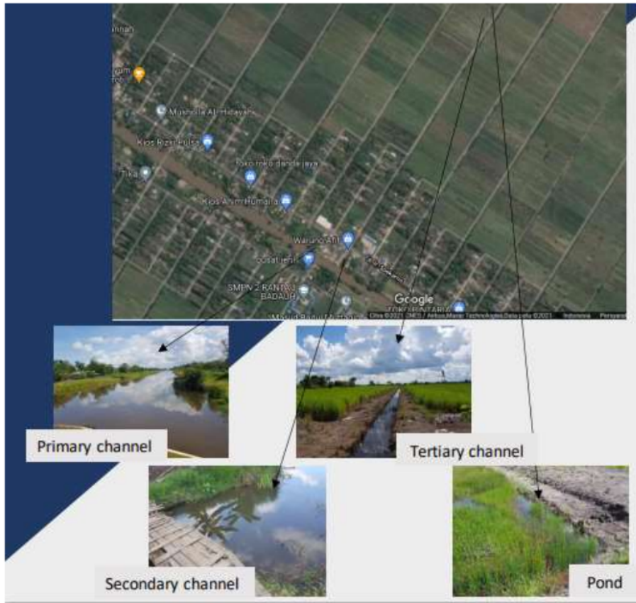
Gambar 1. Lokasi Penelitian DIR Danda Besar Desa Danda Jaya Kabupaten Barito Kuala