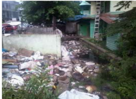
Gambar 3. Kondisi Sungai Veteran pada Sta 23 (1+115)

menyebabkan sampah menumpuk dan menjadi sedimen yang mengakibatkan pendangkalan sungai Veteran.