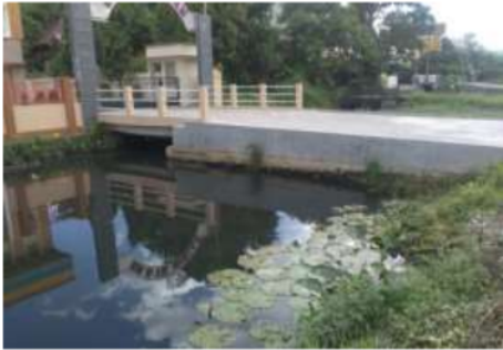
Gambar 1. Kondisi Sungai Veteran pada Sta 15 (0+705)

Penampang pada titik Sta 0 cukup besar untuk menampung debit aliran air baik itu akibat air hujan dan/atau pasangunya air laut, dan cukup memadai sebagai saluran primer untuk jaringan drainase kota Banjarmasin. Akan tetapi masih ada tumpukan sampah pada bantaran sungai yang mengakibatkan terganggunya aliran permukaan sungai Veteran.