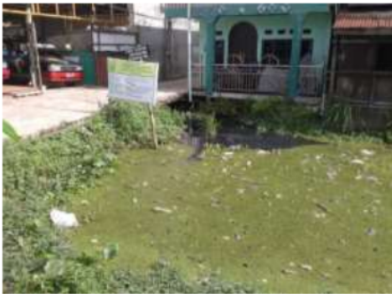
Gambar 2. Kondisi Sungai Veteran pada Sta 22 (1+065)

Pada titik Sta 15 terjadi penyempitan badan sungai yang berakibat pengurangan kapasitas tampungan sungai Veteran, dan adanya bangunan jalan menghambat aliran air pada sungai Veteran.