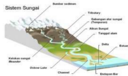
Gambar 1 Sistem Sungai

tenaga listrik, pelayaran, pariwisata, perikanan dan lain-lain. Dalam bidang pertanian sungai itu berfungsi sebagai sumber air yang penting untuk irigasi (Sosrodarsono, 2006).